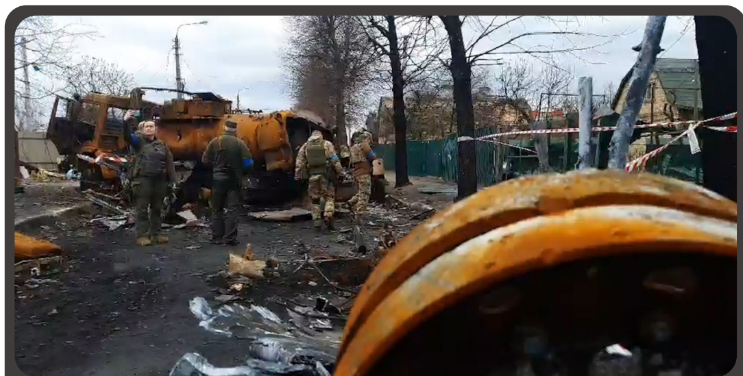
Rruga në Buça ku u zhvilluan luftimet më të ashpra

Në kohë lufte dhe të një krize humanitare, çështja e të drejtave të njeriut shpesh nanashkalohet. Gazetari duhet të bëjë dallimin midis shkeljeve të të drejtave të njeriut dhe rasteve të izoluar. Shpesh akuzat për shkelje të të drejtave të njeriut janë pjesë e betejës së propagandës. Akuzat tilla mund t'i përdor njëra palë për aktivitete të mëtejshme ushtarake ose politike. Kjo është arsyeja pse gazetari duhet të jetë veçanërisht i kujdesshëm me terminologjinë që ai përdor dhe raportimet e tij të bazohen në prova të fuqishme. Çështja e të drejtave të njeriut është aq e ndjeshme sa edhe organizatat që e hulumtojnë atë, intervistojnë dhjetëra dhe dhjetëra njerëz para se të arrijnë në një përfundim dhe të publikojnë një raport të hollësishëm. Gazetarët duhet të jenë të gatshëm të raportojnë mbi shkeljet e të drejtave të njeriut të bëra nga cilido qoftë grup.