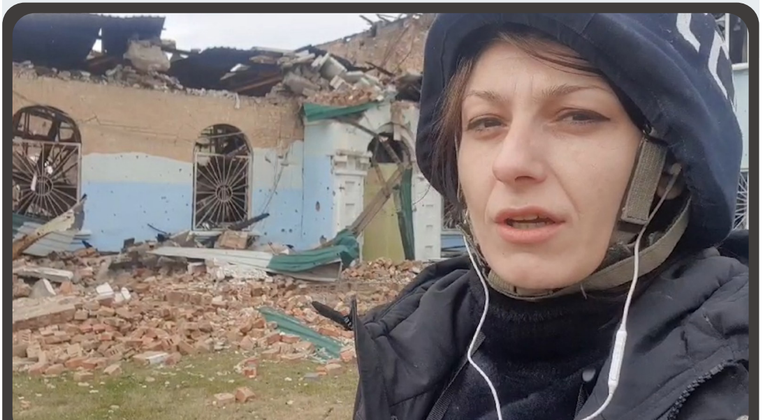
Njoftim nga qyteti Irpin, Ukrainë

Anti-plumb dhe helmëta janë pajisje të detyrueshme. Pa to, akreditimi nuk është i vlefshëm, d.m.th., punëtorët e mediave nuk lejohen të lëvizin në terren nga personeli ushtarak. Sipas rregullit, redaksia ose shoqatat e gazetarëve duhet të furnizojnë pajisjen mbrojtëse me shenjat e duhura “press/shtyp”. Punëtorët e mediave duhet të furnizojnë rroba të rehatshme dhe të ngrohta me ngjyra neutrale. Ndalohet të vishen pajisje taktike, si dhe ngjyra militariste, pasi jeta e punëtorëve të mediave do të rrezikohet nëse duken si militantë. Nga ana tjetër, duhet të shmangen ngjyra mbresëlënëse, të cilat lehtë mund ta kthejnë punëtorin e mediave në shënjestrën e sulmit. Një çantë gjumi dhe çanta e ndihmës së parë janë ndër gjërat e detyrueshme që duhet të jenë pjesë e pajisjeve në zonën e luftës. Përveç kësaj me vete duhet marrë gjërat që janë thelbësore për mbijetesë të paktën një periudhë të caktuar (ushqim, ujë, bateri, llamba). Redaksia duhet të ketë në mend se çmimet në zonat ndërluftuese ndryshojnë dhe mund të ndryshojnë papritmas në varësi të sigurisë së qyteteve dhe se shërbime të caktuara në terren paguhen vetëm me para. Prandaj, redaksia duhet t’i sigurojë burime të mjaftueshme punëtorit mediatik, por gjithashtu të bëjë plane rezervë për tërheqje, në rast se punëtori i mediave mbetet “i mbërthyer”. Gjithashtu, të paktën një person në redaksi duhet të dijë në secilin moment se ku është punëtori i mediave.