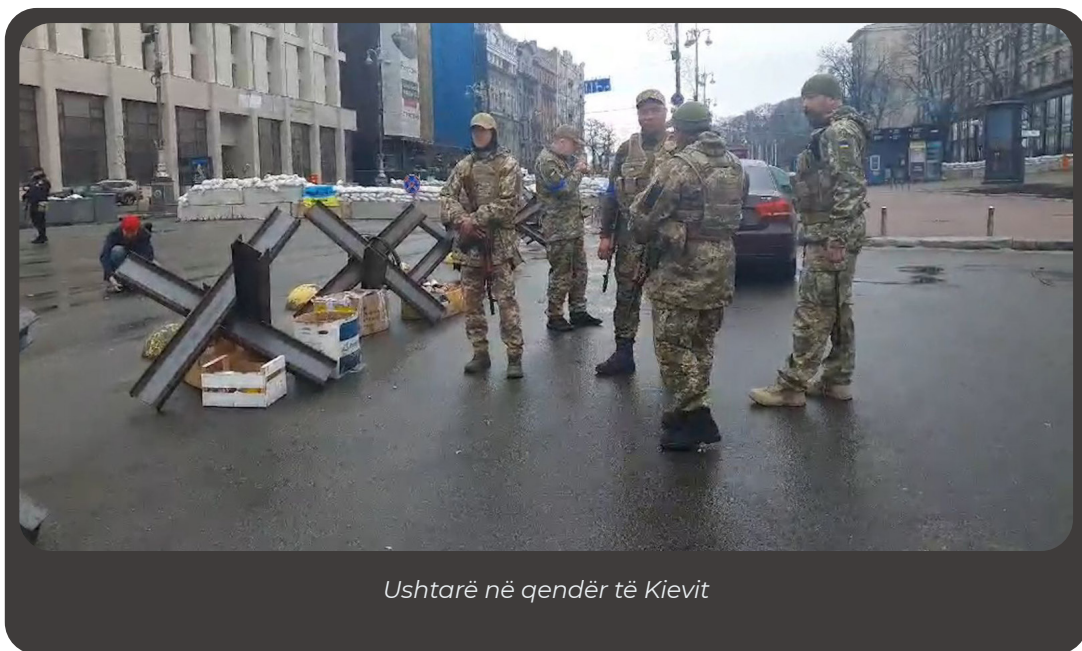
Ushtarë në qendër të Kievit

Ajo që në të kaluarën ishte një mision për kundërbueluesit, tani mund të bëhet pa dashje nga civilët të zakonshëm me një aparat fotografik në telefon dhe qasje në internet. Konkretisht, në Luftën në Ukrainë, informacioni i parë që vjen nga zyrtarët në momentin kur dëgjohet shpërthimi është lutja dhe udhëzimi për të mos publikuar informacione për vendndodhjen, foto dhe video që tregojnë skenën, derisa kjo të bëhet zyrtare. Kjo kërkesë e qeverisë vlen si për civilët ashtu edhe për gazetarët dhe arsyja, sipas autoriteteve të Ukrainës, është të mos u jepen informacione armikut. Për të njëjtat arsye është e ndaluar rreptësisht të publikohen në çfarëdo çast informacione ose pamje vizuale të ushtrisë, nga ushtria, objektet ushtarake dhe lëvizjes së teknikës së ushtrisë.