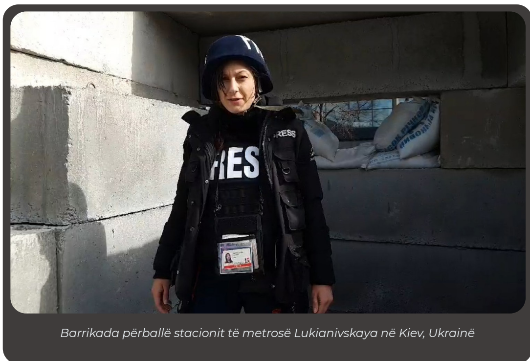
Barríkada përballë stacionit të metrosë Lukianivskaya në Kiev, Ukrainë

Kur një vend është në gjendje lufte, rregulloret se çfarë lejohet dhe si duhet të silltet një shtetas i huaj në atë vend në terren ndryshojnë vazhdimisht. Një punonjës i medias që nuk e njeh ose nuk ndjek ndryshimin e këtyre rregulloreve rrezikon të arrestohet/ndalohet nga autoritetet kombëtare. Gazetarët dhe kameramanët në terren jo vetëm që duhet të jenë të vetëdijshëm për rreziqet që u kërcënohen për jetën e tyre dhe lirinë e lëvizjes, por duhet të jenë të vetëdijshëm edhe se përmes raportimit të tyre apo publikimit të llojeve të ndryshme të përmbajtjeve (video) mund të shkaktojnë dëme me pasoja fatale.