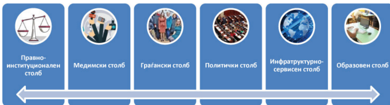
Графикон 1: Општествени столбови за справување со говорот на омразата

стратегии во справувањето со говорот на омраза. Па, така, на пример, во Германија главниот фокус е на инфраструктурно-сервисниот столб, односно зголемен притисок врз провајдерите и сервисите во отстранување на содржините со говор на омраза. За С. Македонија важно е паралелно со зајакнувањето на општествената поврзаност и вклученоста на институциите и организациите, да се детектираат приоритетните релации за соработка во изведување на неопходните активности кои видливо ќе ги подобрат состојбите со говорот на омраза во општеството.